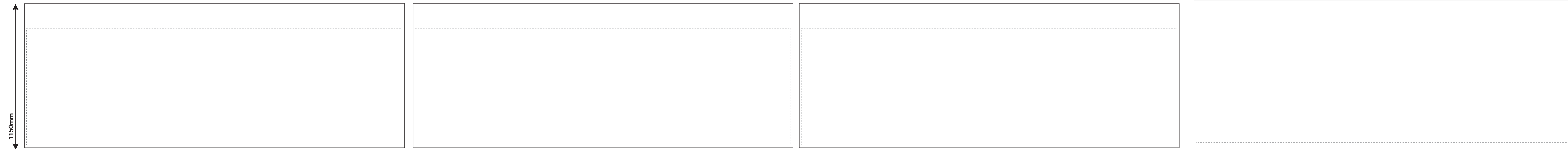
Fram Halv vägg